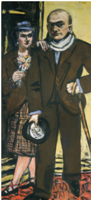
Max Beckmann, Doppelbildnis von Quappi und mir, 1941

Max Beckmann hat sich in seinem Werk wiederholt mit religiösen und mythologischen Themen beschäftigt und sie in Beziehung zu seiner eigenen Persönlichkeit gesetzt. So werden Perspektiven für einen zeitgemäßen Umgang mit religiösen Inhalten sichtbar.