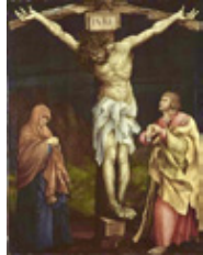
Matthias Grünewald, Karlsruher Altar, 1524