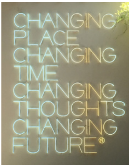
Maurizio Nannucci, 2003

Bis zum Herbst kehren wir wieder bei den Gemeindeabenden an den Dienstag zu Anfangszeit 19:30 Uhr zurück.